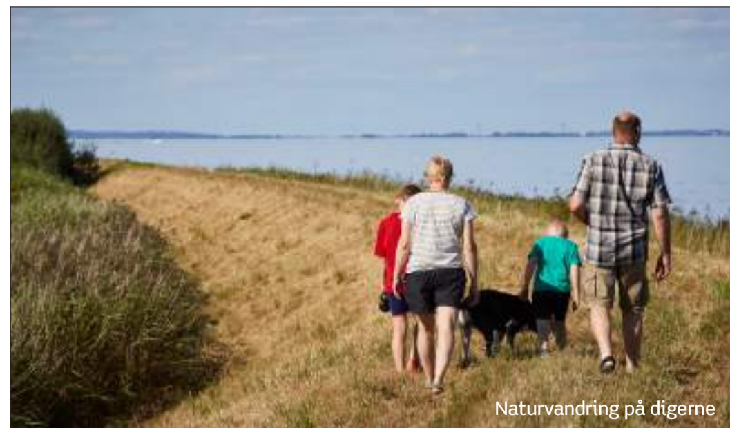
Naturvandring på digerne