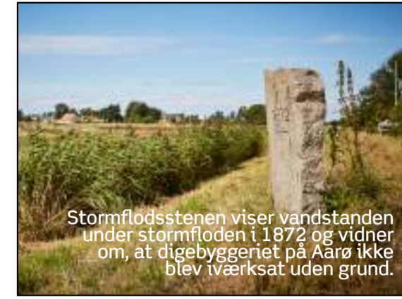
Stormflodsstenen viser vandstanden under stormfloden i 1872 og vidner om, at digebyggeriet på Aarø ikke blev iværksat uden grund.

Denne korte tur går ind imod byen og mod nord til Løkke. Inden man når byen, passerer man en bro og diget med stormflodsstenen. Bag diget er der en lille plads, "æ bøes" (børsen), som i dag fremstår som en udvidelse af vejen. I tidligere tider var det stedet, hvor byens mænd mødtes dagligt for at udveksle nyheder og drøfte vejr og vind. Fra Løkke skal man samme vej tilbage.