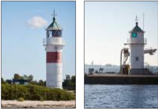
Aarøsund og Aarø Fyr assisterer sejladsen i det smalle Aarø Sund

På havneområderne er der: Toiletter, bad, borde, bænke, grillplads Kiosk Affaldscontainere Havnekontor