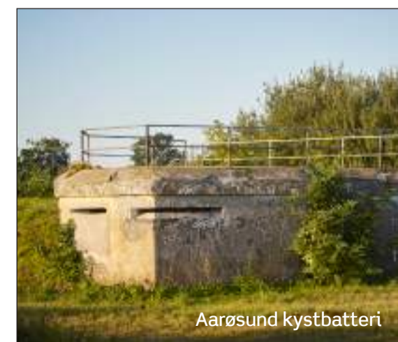
Aarø Sund kystbatteri

Ruten går langs stranden mod nord. Fra kysten går stien på en plankebro tværs over "Barsmose", som er et kystnært lille moseområde. Herfra ledes man over en eng med græssende dyr og videre langs hegn og mark op til Færgevej. Herfra kan man vende tilbage til Aarø Sund Havn, men den afmærkede rute går videre mod syd ad Hørlykkevej via markveje gennem dyrkede marker. Undervejs er der en storslået udsigt ud over Lillebælt. Ruten går forbi campingpladsen og videre til kysten, hvor man langs stranden når tilbage til Aarø Sund Havn.