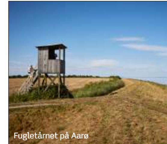
Fugletårnet på Aarø